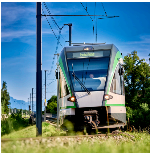
Transports publics de la région lausannoise

La ligne Lausanne–Echallens–Bercher (LEB) – autrefois surnommée « la brouette » par les habitants du Gros-de-Vaud en raison de sa lenteur – se transforme peu à peu en véritable RER régional. Il y a encore peu, les trains qui relient notre Bourg à Lausanne circulaient deux fois par heure. Depuis 2020, la cadence est passée au quart d'heure. Des réflexions sont en cours et l'objectif est de proposer une cadence à 10 minutes entre Echallens et Lausanne-Flon.